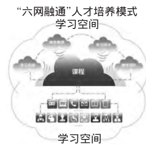
图1 “六网融通”人才培养模式

人才培养模式改革,它是一种基于互联网的支持自主学习和泛在学习、培养职业性技术型人才的新型培养模式。